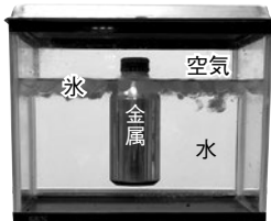
▲屋台で販売されている缶ジュースを横からみた提示モデル。

「金属は熱せられた部分から順に温まるが、水や空気は熱せられた部分が移動して全体が温まる」の学習後、屋台で見られるような氷水に缶ジュースを浮かべた水槽を子どもたちに提示し、水槽の中で最も冷たいところについて考えました。