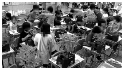
児童たちの観察の様子

児童の継続観察の活性化を図るため、観察の視点を焦点化する。「今日は、自分の一番お気に入りのところをくわしく見てみよう」「前と変わったところを見てみよう」「今日は色に注目して記録をかいてみよう」「どのくらい大きくなったかな」等、具体的に声かけをしていく。また、友達の植物と比べて、似ているところや違うところにも目を向けられるようにする。ルーペ等も使って植物の体のつくりを焦点化して観察し、拡大した図で記録することによって、細かい部分ま